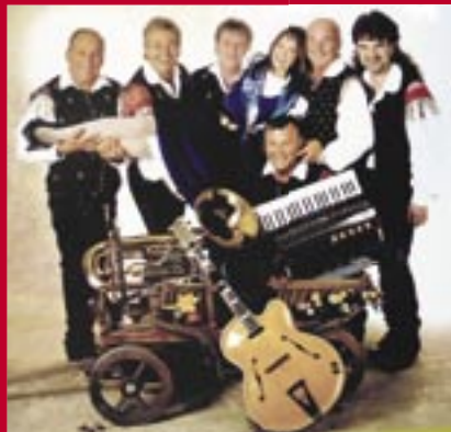
Orig. Oberkraimer Sextett