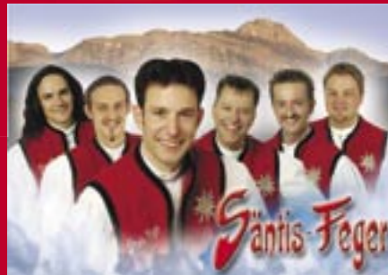
Die Stimmungskanonen aus dem Appenzell

Samstag 12. Juni 04, Einlass 17.30 Uhr, Beginn 20.00 Uhr Ende 02.00 Uhr